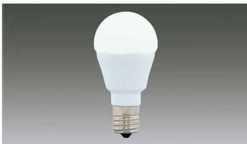
LED電球 E17広配光タイプ