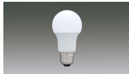
LED電球 E26広配光タイプ 60形相当 電球色 810lm