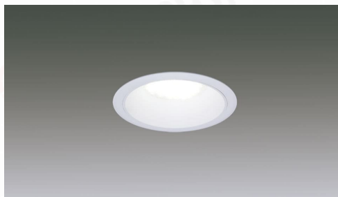
LEDダウンライト 大光量タイプ 埋込穴径φ125