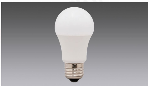
LED電球 E26広配光タイプ 60形相当 昼白色 810lm