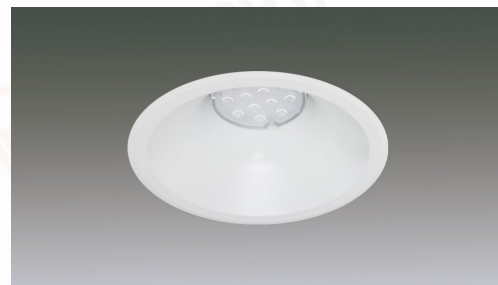
LEDダウンライト リニューアルタイプ 調光対応