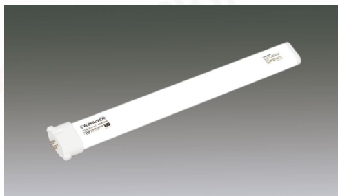
コンパクト蛍光灯 片口金LEDランプ 36形