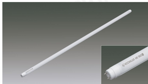
直管LEDランプ ECOHiLUX HE160S