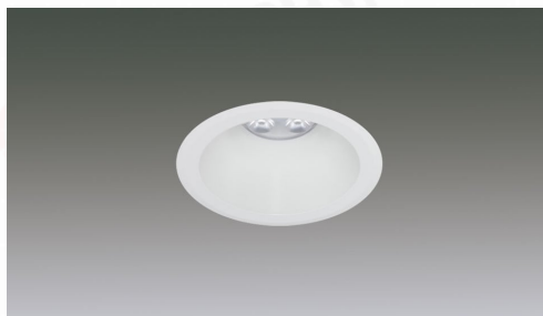
LEDダウンライトリニューアルタイプΦ100-Φ75 5灯 1/2配光角50°5000K 調光対応