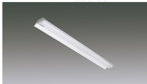
ラインルクス笠付型 40形 調光