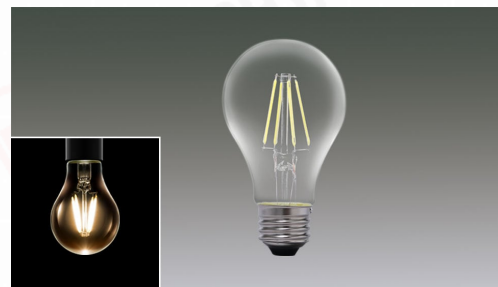
LEDフィラメント球 E26 調光器対応 60形相当 810lm 電球色