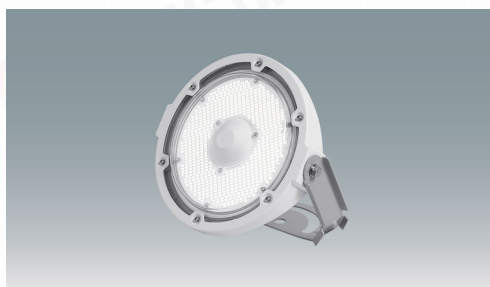
高天井LEDランプ RZ-R 投光器