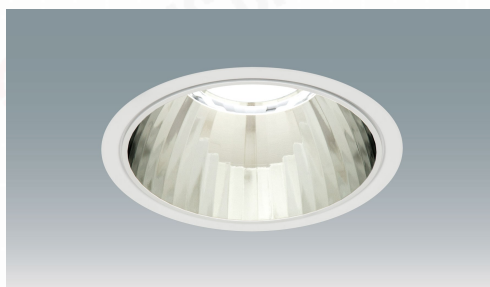
LEDダウンライト 大光量タイプ埋込穴φ200