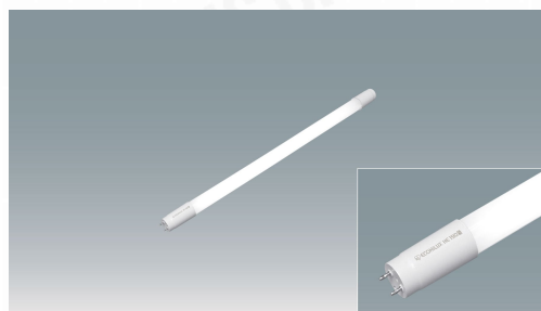
直管LEDランプ ECOHiLUX HE190S (両側給電)