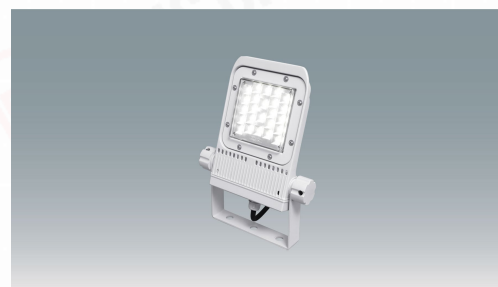
角型投光器 昼白色 40W 広角