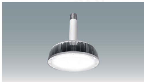
高天井LEDランプ RZシリーズ