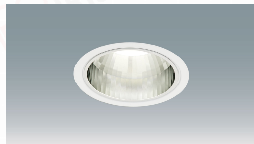
LEDダウンライト 大光量タイプ 埋込穴径φ150 調光調色タイプ