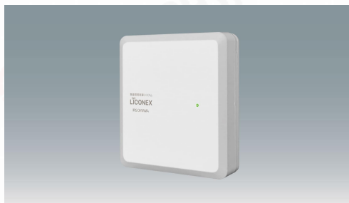
ベースモジュール LiCONEX3.0対応(照明制御専用)IRLI-BM-V3