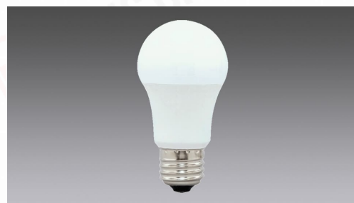
LED電球 E26 全方向 60形相当 電球色