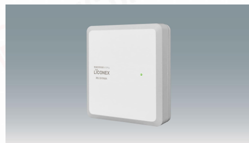
ベースモジュール LiCONEX3.0対応(照明制御専用)