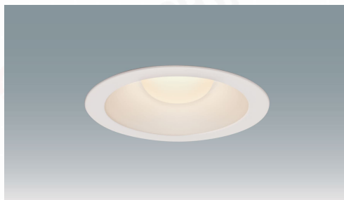
高気密SB形 LEDダウンライト