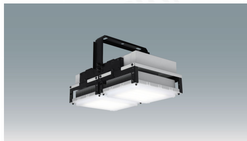
高天井用LED照明 HX-R 調光調色 Liconex 拡散カバー