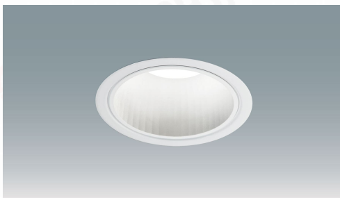
LEDダウンライト 大光量タイプ 埋込穴径φ150 調光タイプ