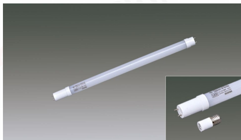
グロー対応直管 15形