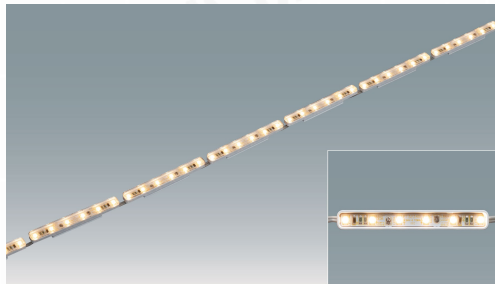
フレキシブルユニット 6LED