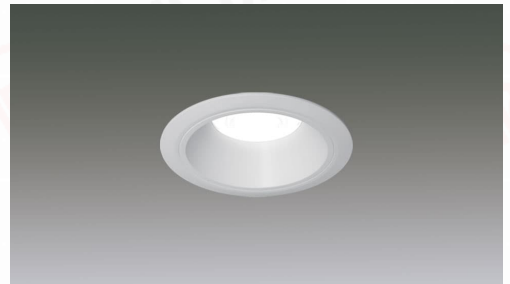
LEDベースダウンライトφ75 PWM調光