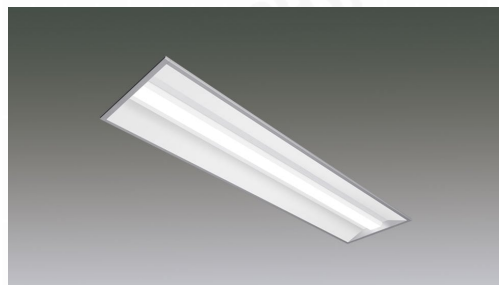
ラインルクス埋込型 LiCONEX調光 40形 幅300