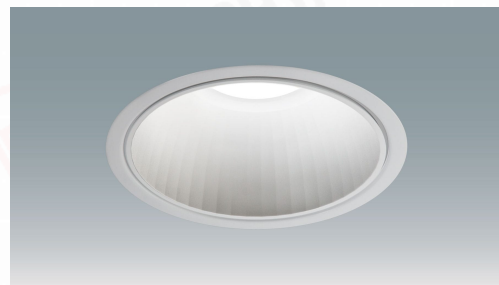
LEDダウンライト 大光量タイプ 埋込穴径φ200