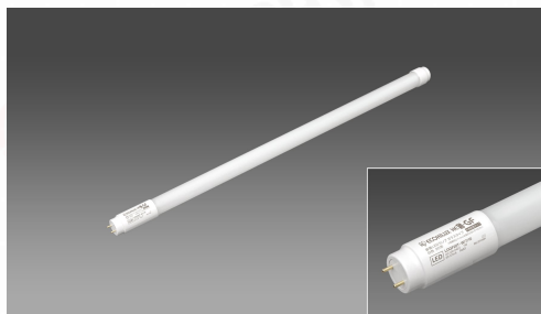
ガラス直管LEDランプ 20形(電源内蔵)