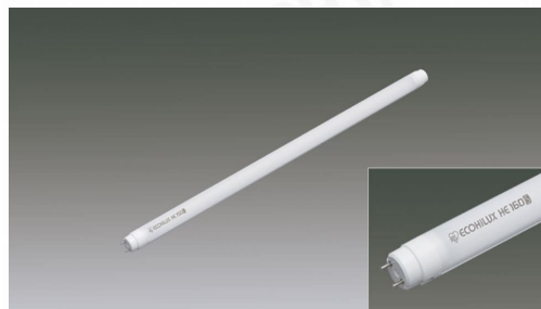
直管LEDランプ ECOHiLUX HE160S