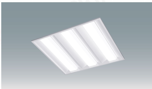
LXスクエア照明埋込型 □450 LiCONEX調光