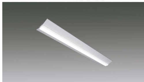
ラインルクス 直付型 LiCONEX調光 40形 幅230