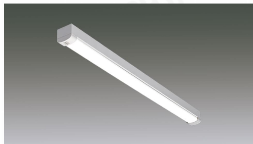
ラインルクストラフ型 防雨・防湿型 非調光 40形