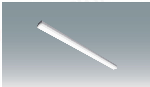
ラインルクストラフ型 非調光 40形