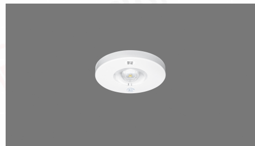
LED非常用照明器具 LED専用型 埋込型 低天井用 φ60