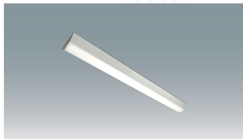
ラインルクス 直付型 非調光 40形 幅150