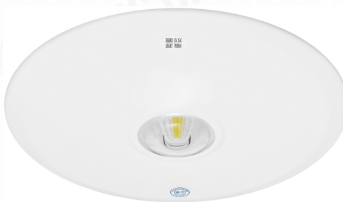
LED非常用照明器具 LED専用型 埋込型 低天井用 φ100