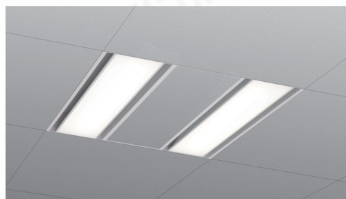
グリッドシステム天井用照明 2灯□600