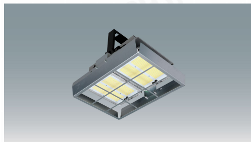
HXR205-100・150・200N用 下面ガード