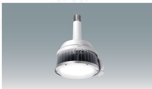
高天井用LED照明 RZ-R 低グレアタイプ LiCONEX