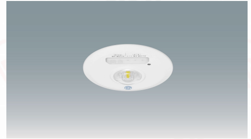
非常灯 低天井用 埋込形 φ150