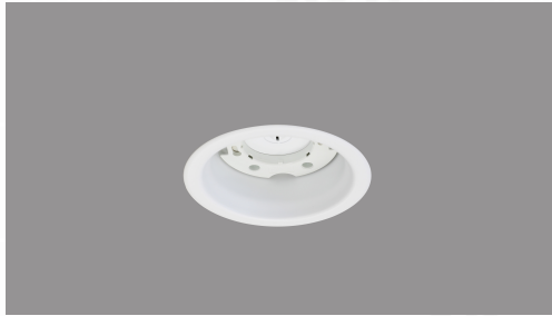
SB形ダウンライト GX53:GX53専用器具 φ100