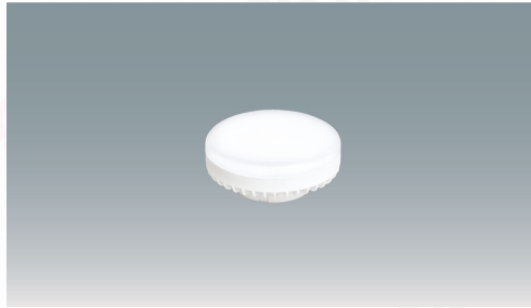
LED電球 温白色 GX53