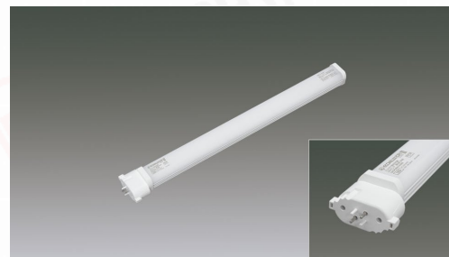
コンパクト蛍光灯LED代替ランプ