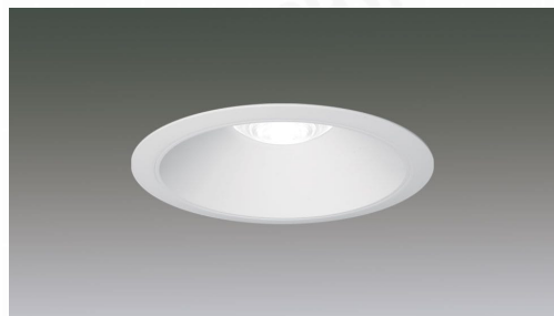
LEDダウンライト ベースダウンライト