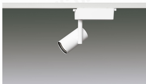
LEDローグレアスポットライト