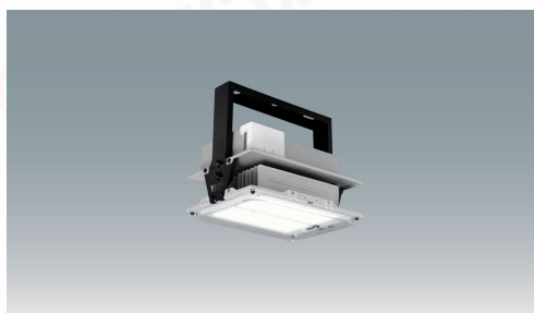
高天井用LED照明 HX-R LiCONEX