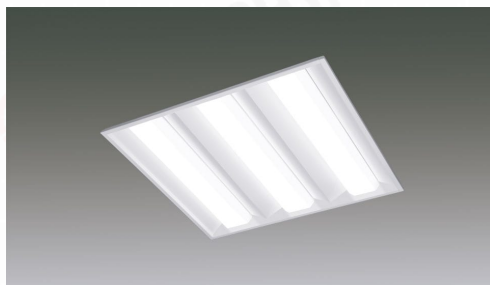
LXスクエア照明埋込型 □450 PWM調光