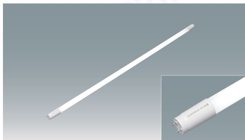
直管LEDランプ ECOHILUX HE190S (片側給電)