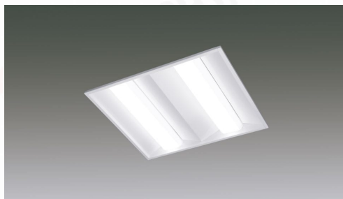
LXスクエア照明埋込型 □350 PWM調光