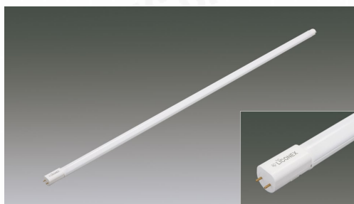
直管LEDランプ 無線調光対応 32形 LiCONEX高効率タイプ(片側給電)