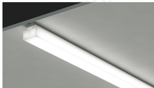
ラインルクスエッジ 直付型 非調光 1200mm