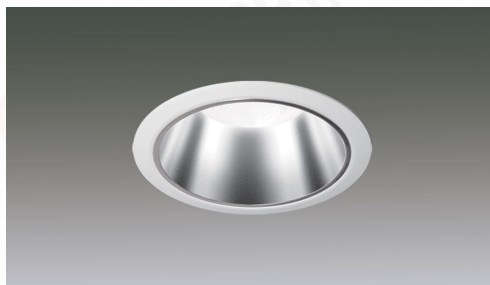
LEDベースダウンライトφ100 LiCONEX