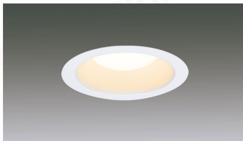
LEDダウンライト 高気密SB形ダウンライト