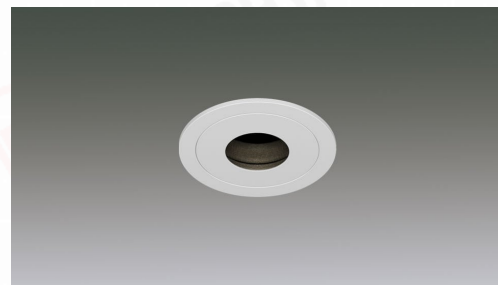
LEDピンホールユニバーサルダウンライト