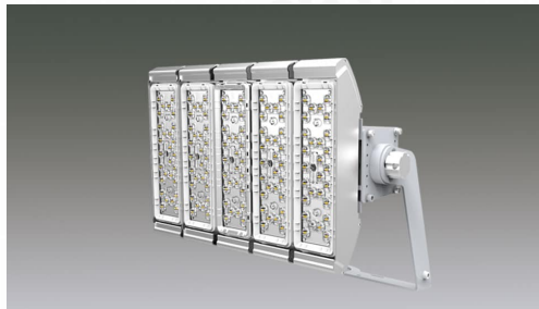
LED投光器 大光量タイプ HW-F