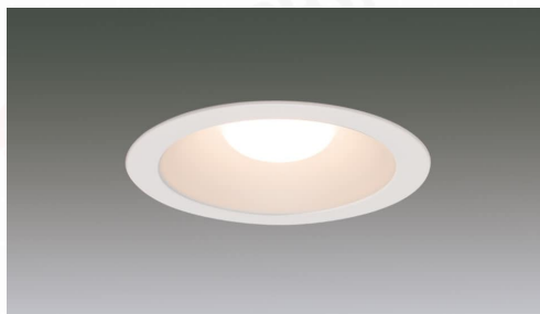
LEDダウンライト 高気密SB形ダウンライト