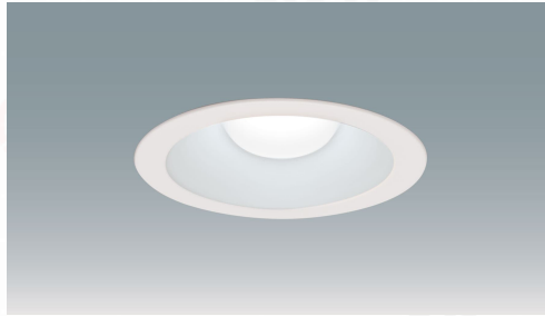
LEDダウンライト 高気密SB形ダウンライト