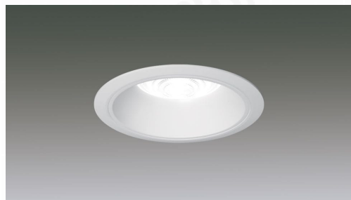
LEDダウンライト ベースダウンライト