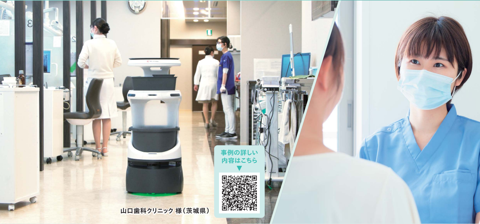
山口歯科クリニック 様(茨城県)