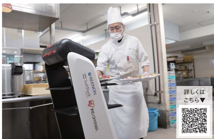
片山津温泉 NEW MARUYAホテル(湯快リゾート株式会社)様(石川県)