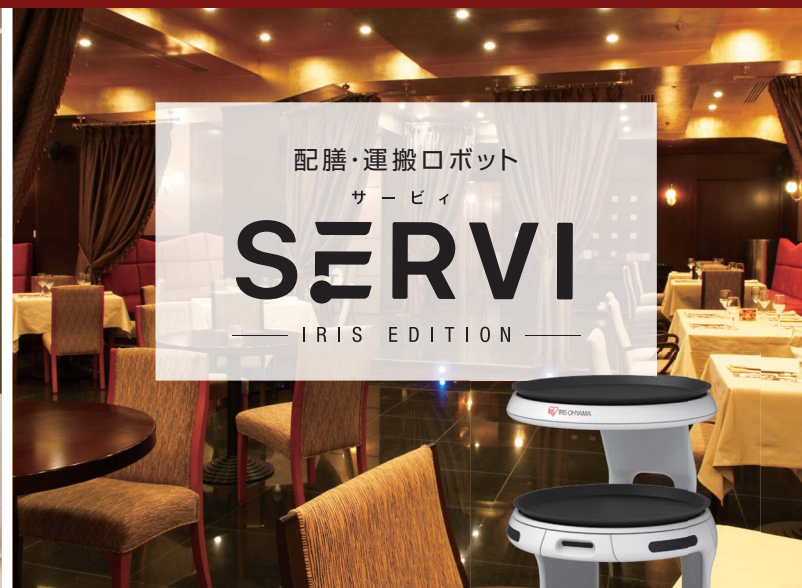
配膳・運搬ロボット サービィ