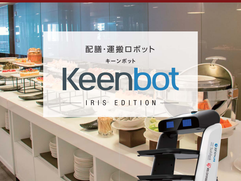
配膳・運搬ロボット キーンボット