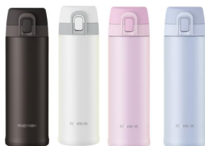
ブラック・ホワイト・ピンク・ブルー