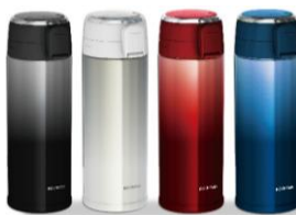
ブラック・ホワイト・ピンク・ブルー