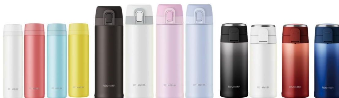
▲スクリュウタイプ (300ml)