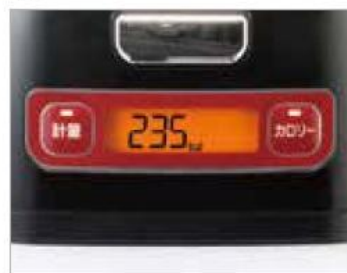
カロリーが表示されます