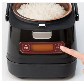
カロリーボタンを押す