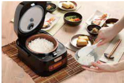
おひつとして食卓に

本体が分離式になっており、上部はおひつとして下部は IH 調理器として使用することができます。