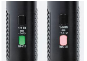
緑：ほこりが少ない 赤：ほこりが多い