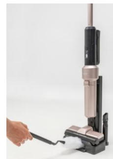
掃除機のスタンドに搭載している放電プレートが除電し、掃除機本体でモップに付いたホコリを吸引