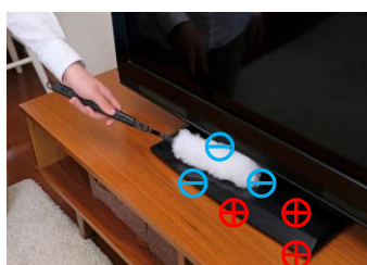
床掃除をしながら、気になるホコリを静電気を帯びたモップで吸着