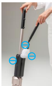
掃除機に装着しているモップ帯電ケースで静電気を発生