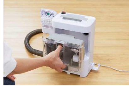
タンクを外して排水