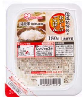
低温製法米のおいしいごはん 1P