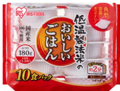
低温製法米のおいしいごはん 10P