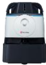
Whiz i アイリスエディション