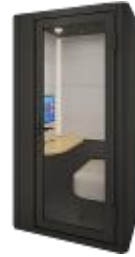
TELECUBE by IRISCHITOSE