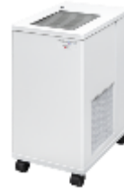
PlasmaGuard PRO™ アイリスエディション置き型